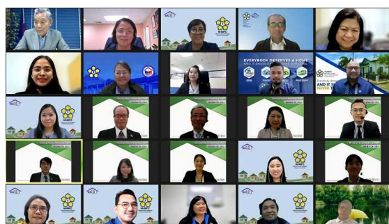
フィリピン NHMFC 向け研修